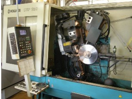
Vollmer CHP 250 NC-gesteuerter Vollautomat zum Schärfen von HM-Kreissägen in mehreren Arbeitsgängen.