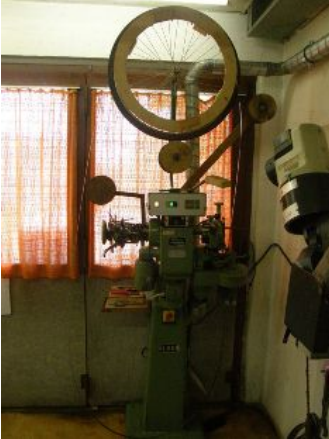
NC-gesteuerter Schärfautomat Zum Nachschärfen und Neuerzählen von HSS-Sägen.