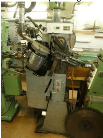
elektromechanisch gesteuerter Vollautomat Zum Absetzen von MH-Kreissägen. (Eigenkonstruktion von Max Schneebeili)