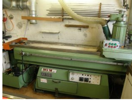
Zum Schleifen von Kehlwerkzeug, Hobelköpfen und Fräsern für Holz.