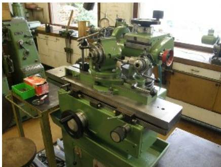
Cincinati Nr. 1 Universal Werkzeugschärfmaschine für manuelle Bedienung.